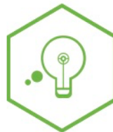
THINKING CAPACITÉ DE RAISONNEMENT